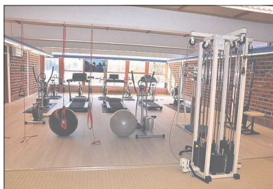
NYTT TRENINGSSENTER: Klart for bruk av kjente og ukjente muskler til alle døgnet tider.